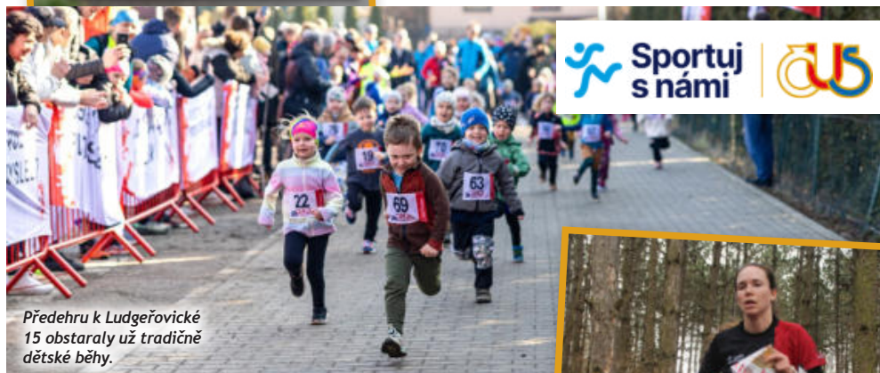
Předehrů k Ludgeřovické 15 obstaraly už tradičně dětské běhy.