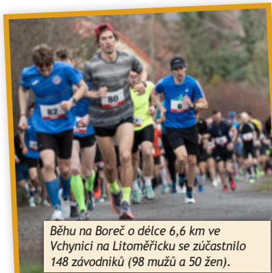
Běhu na Boreč o délce 6,6 km ve Vchyníci na Litoměřicku se zúčastnilo 148 závodníků (98 mužů a 50 žen).

Také v měsíci březnu zaslali organizátoři některých akcí v rámci projektu ČUS Sportuj s námi fotografickou připomínku.