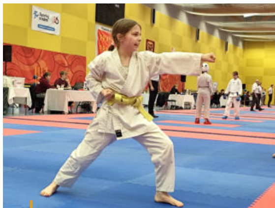
Přesně 465 mladých bojovníků se zúčastnilo letošního ročníku pražského poháru Kamiwaza Cupu v karate.