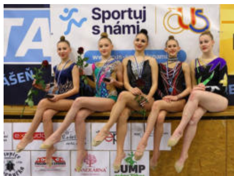
Milevský pohár v moderní gymnastice byl pro mnohé aktérky prvním závodem sezony - nejúspěšnější z nich se seřadily na snímku.