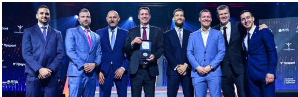
Český volejbalový tým, který na MS v minulém roce postoupil až do semifinále, zvolili novináři nejuspěšnějším kolektivem.

Tradiční prosincové vyhlášení nejlepších osobností a kolektivů v rámci ankety Sportovec roku představovalo symbolickou tečku za celou loňskou sportovní sezónou. Fanoušci mohli opět vidět na televizních obrazovkách některé ze svých oblíbených reprezentantů ve slavnostním oděvu. Tuto událost připomínáme ještě fotografickým pohledem do zákulisí gala večera.