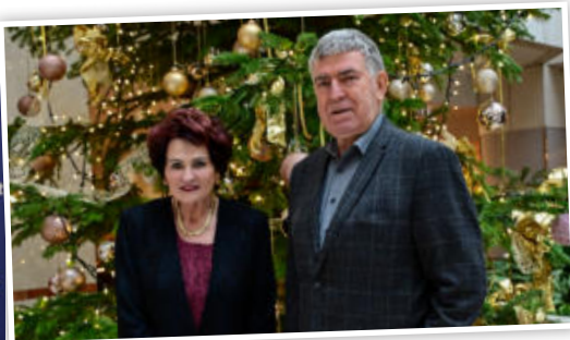
Sportovními legendami a nositeli Ceny Emila Zátopka za rok 2025 se stali atleti Helena Fibingerová a Imrich Bugár.