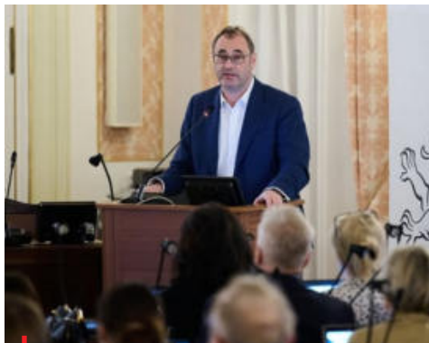
Ministr Boris Št'astný při setkání se zástupci sportovních svazů.

Ještě letos chce Boris Št'astný předložit a prosadit návrh nového zákona o sportu a pohybu, který by zakotvil i postavení zasloužilého olympionika. „Pokládáme za společenskou povinnost, tak jak je to i u veteránů, abychom se nějakým způsobem k této věci postavili,“ poznamenal mi-