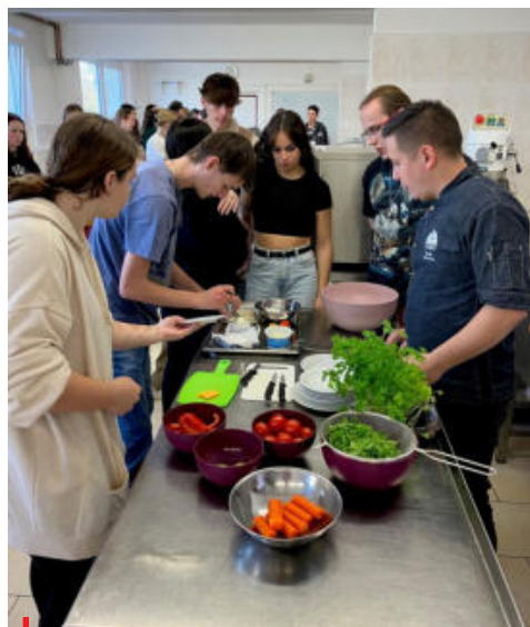
Zdravá strava musí být základem jídelníčku každého sportovce.

Z tohoto důvodu nestačí řešit obtíže pouze úpravou jídelníčku nebo spoluprací s nutričním terapeutem. Bez práce s psychickými faktory,