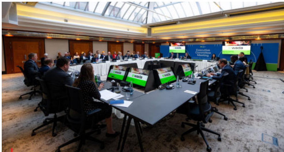
V září hostila Praha zasedání Výkonného výboru Světové antidopingové agentury (WADA).

2-Fenylbenzo[h]chromen-4-on, známý také jako \alpha -naftoflavon nebo 7,8-benzoflavon, byl přidán jako příklad inhibitoru aromatázy. Tato syntetická látka se nachází v doplňcích stravy.