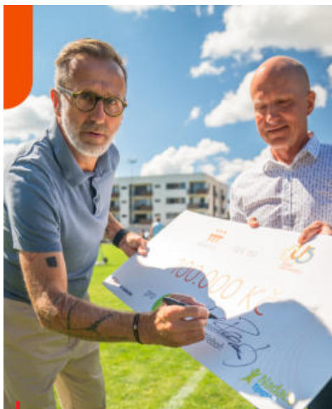
Karel Poborský při podpisu šeku na 100 000 Kč.

V rámci projektu jsou oceňovány kluby, kde začínali svou sportovní cestu úspěšní reprezentanti, kteří se později prosadili mezi světovou špičku. Každý oceněný oddíl získal šek na 100 tisíc korun určený na podporu a rozvoj sportu dětí a mládeže. Šeky předávali samotní šampioni společně se zástupci České unie sportu.