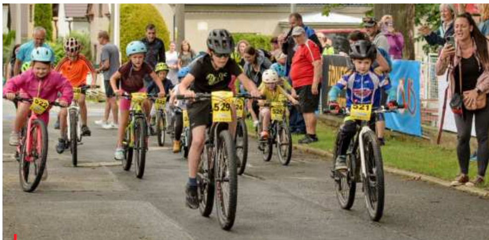
Projekt ČUS Sportuj s námi bude pokračovat pod původním názvem