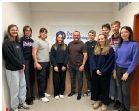
Studenti Managementu sportu FTVS Univerzity Karlovy na praxi v Českém Antidopingu.

Účast na akcích, jako je Olympiáda dětí a mládeže, nám umožňuje mluvit o fair play přímo tam, kde se rodí budoucí šampioni. Vzdělávání nejde dělat od stolu - chceme naslouchat, diskutovat a inspirovat se. Proto jsme vyrazili se vzdělávacím stánkem na Olympiádu dětí a mládeže - tentokrát do Haly Polárka ve Frýdku-Místku, kde jsme předávali antidopingové znalosti účastníkům i návštěvníkům ODM.