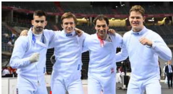
Bronzoví kordisté z OH 2024

Sportovní psycholog tak může sportovcům pomáhat s překonáním nějaké aktuální zátěže, která zasahuje i do sportovního výkonu (např. překonání nepříjemného zranění, zkouškové období, přechod do nového týmu), stejně tak může být nápomocen při dosahování krátkodobých/aktuálních cílů, např. v podobě zvládnutí nomináčních závodů aj. Se sportovci lze ale pracovat také dlouhodobě, obvykle se záměrem poražení systematické psychologické přípravy k optimalizaci výkonu a naplnění potenciálu, nebo prevenci předčasného ukončení sportovní kariéry. Možností je také práce s celým sportovním týmem, což s sebou nese větší nároky na čas psychologa a spolupráci s trenérem/y.