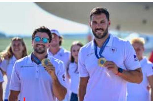
Zlatí medailisté z Paříže Josef Dostál (vpravo) a Martin Fuksa.

Poprvé v historii ankety byli ve finálovém výběru zástupci pouhých čtyř sportů. V desítce figurují tři tenisté a hokejisté a dva rychlostní kanoisté a atleti. Barbora Krejčíková již potřetí obsadila druhé místo. Kromě ní byli v desítce nejlepších také tři hokejoví mistři světa a dva atleti - bronzová olympijská medailistka Nikola Ogrodníková a mistr Evropy Jakub Vadlejch.