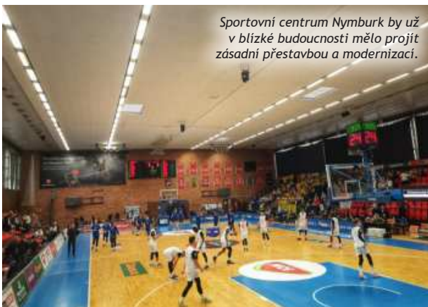
Sportovní centrum Nymburk by už v blízké budoucnosti mělo projít zásadní přestavbou a modernizací.

Důležitým bodem jednání byla také obšírná diskuse k Etickému kodexu sportu a Etickému kodexu správného trenéra, který předložila Národní sportovní agentura ke konzultaci a připomínkám střešním sportovním organizacím včetně České unie sportu. ČUS tuto iniciativu vítá a domnívá se, že myšlenky a úvahy, které obsahují, by byly nepochybně přínosné pro spor-