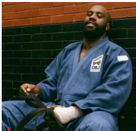
Francouz Teddy Riner patří k velkým hvězdám světového sportu. V judu pak je absolutní legendou historie tohoto odvětví.

Kempu v Nymburku, který skončil v pondělí, se účastnilo zhruba 600 judistů a judistek včetně