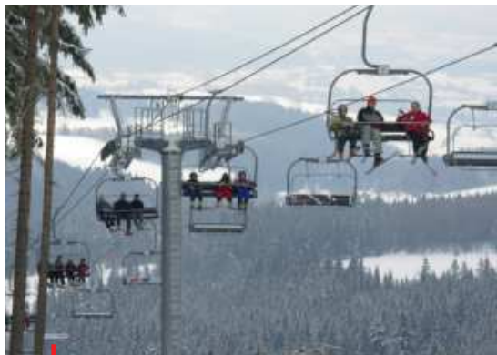
Zimní sezona v Lyžařském areálu Zadov skončila letos velice brzy

V dalším průběhu schůze VV ČUS schválil pověření zástupce ČUS k výkonu akcionářských práv na valné hromadě společnosti Sportovní areál Ha-