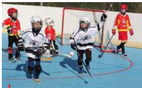
Děti by měly sportovat hodinu denně.

Zdroj: Nadační fond Aktivní ČESKO Foto: Tipsport Sportuj s námi