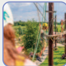
Herní prvky pro volný čas a zábavu