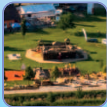
Dětská hřiště a zábavné prvky