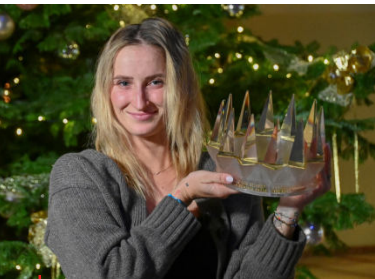
Loňská wimbledonská vítězka Markéta Vondroušová začínala se svým sportem v Tenisovém klubu Sokolov