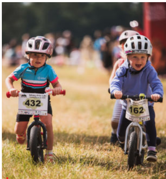
Tam, kde není registrováno dvacet mladých sportovců, kluby už na dotaci od NSA nedosáhnou

Členové Výkonného výboru ČUS reagovali na důsledek novely zákoníku práce a přijetí tzv. vládního konsolidačního balíčku. V něm obsažená nová právní úprava uzavírání dohod o pracích konaných mimo pracovní poměr - především dohod o provedení práce (DPP) - se velice negativně dotkla celého sportovního prostředí a nesmírně komplikuje, často dokonce znemožňuje použití tohoto smluvního nástroje.