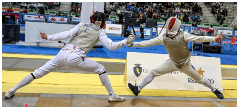
Mezi prioritizovanými sporty nechybí ani Český šermířský svaz