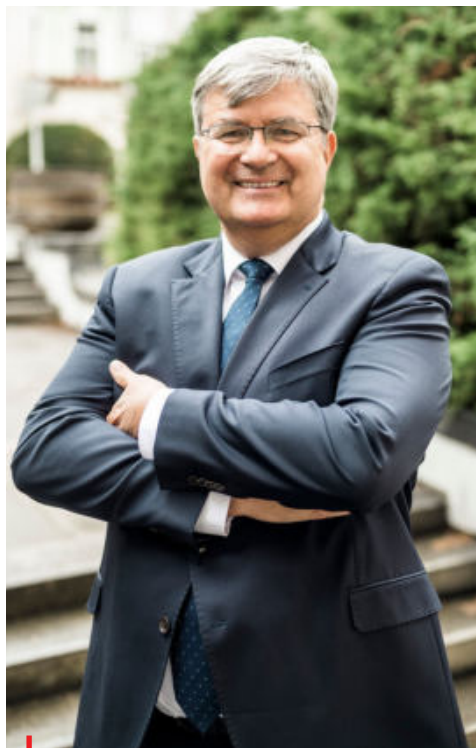
Miroslav Jansta, předseda České unie sportu

V oblasti státního rozpočtu na rok 2024 se odehrál velký boj o sportovní peníze. Ministerstvo financí v současné ekonomické a rozpočtové tísní původně navrhlo pouze 5,2 miliardy, což by bylo