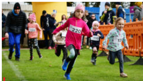
Statistická data ukazují, že ve věku pět až devatenáct let nejvíce sportuje populace v Jihočeském kraji

Autor: KT ČUS, foto: Tipsport Sportuj s námi