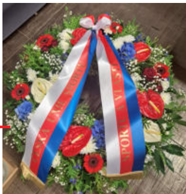
Věncem, jímž ČUS uctila Památný den sokolstva

Tradiční pietní akt se konal v sídle České obce sokolské v Tyršově domě. Položení věnců a květin u pamětní desky se jmény zavražděných a umučených členek a členů Sokola se zúčastnilo mnoho významných hostů v čele s Milošem Vystrčilím, předsedou Senátu Parlamentu ČR. „Nevzpomínejme na Sokoly jako na někoho, kdo pomohl vytvořit svobodnou a demokratickou společnost, ale berme si z nich a z jejich konání příklad pro dnešek a pro budoucnost. Je to pro nás velmi důležité, možná zásadní,“ řekl Miloš Vystrčil.