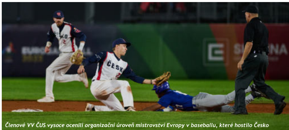
Členové VV ČUS vysoce ocenili organizační úroveň mistrovství Evropy v baseballu, které hostilo Česko

ket by měl jako každý rok přesáhnout šedesátku. Produkce ze strany agentury bude opět využita pro propagaci smluvních partnerů ČUS. Výkonný výbor dále schválil záštitu projektu lyžařských běžeckých závodů pro veřejnost Stopa pro život a také půjčku z Rezervního fondu sportovních svazů ČUS žadateli z řad národních sportovních svazů.