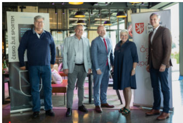
Účastníci setkání s předsedou Národní sportovní agentury

Bezprostředně po tomto jednání představitelé České unie sportu a Sdružení sportovních svazů