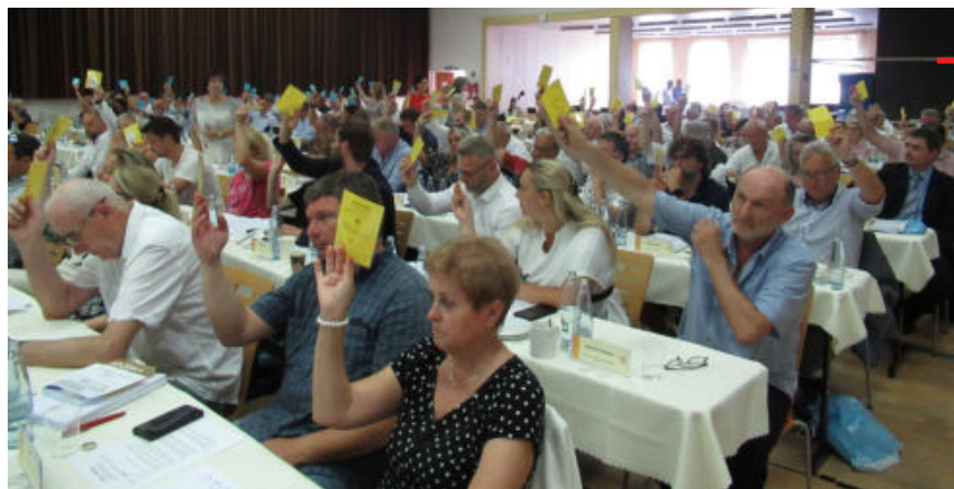
Delegáti 41. valné hromady při hlasování