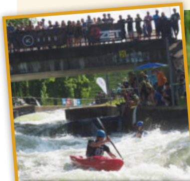
Schopnosti kanoistů i kajákářů dokonale prověřil závod Trnava X-race na nejtěžší vodácké trati v Evropě.