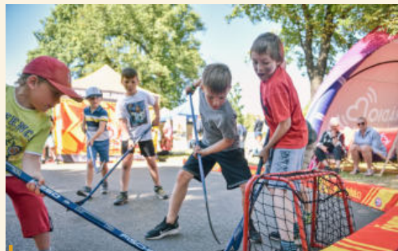
Šestě Hradecké sportovní hry nabídl turnaje v osmi netradičních odvětvích a také tři desítky stanovišť pro dětské návštěvníky.