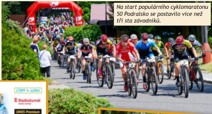
Na start populárního cyklomaratonu 50 Podralsko se postavilo více než tři sta závodníků.

Rekordní počet 104 akcí po celé České republice nabídl červnový kalendář projektu České unie sportu Tipsport Sportuj s námi. Nabízíme obrazovou připomínku několika akcí, kterou nám zaslali jejich organizátoři.