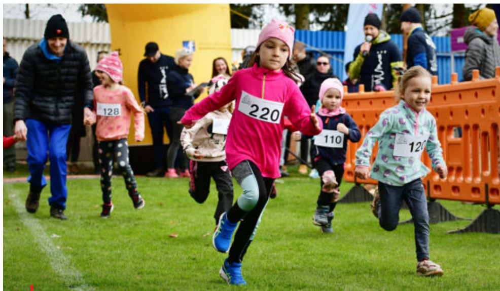
Politici se k českému sportu chovají macešsky - chybí jim odvaha