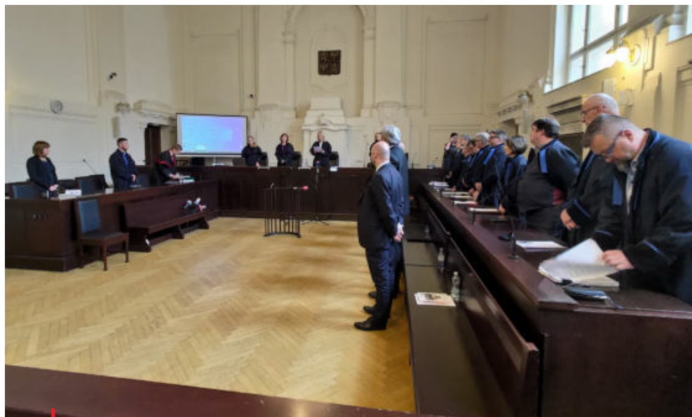
► Tzv. kauzu sportovních dotací projednával Městský soud v Praze

„Nechci nikoho jmenovat. S ČOV jezdilo daleko více úředníků z MŠMT. Ale pokud se mě ptáte, co mi soud ukázal o fungování ministerstva, tak tohle mě šokovalo. To jsou přece nenormální věci. Bavil jsem se o tom například s Němci, kteří kroutili hlavou, co se u nás děje. Tam když státní úředník, který rozděluje peníze, chce někam na pozvání jet, musí to hlásit ministroví. Tady jeli na olympiádu a další olympijské akce