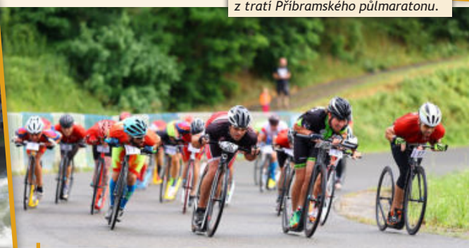
Do Plzně přilákal 24. ročník Zlaté koloběžky vyznavače tohoto atraktivního sportu z celé České republiky.