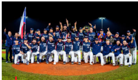
Čeští reprezentanti v baseballe slavi postup na World Baseball Classic

A ani budoucnost není bůhvíjak růžová. Stačí se podívat na rozpočet pro rok 2023.