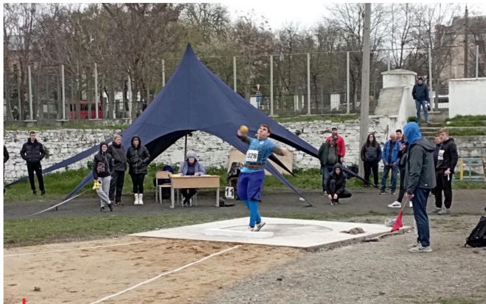
Mnozí ukrajinští sportovci se připravují a soutěží v náročných podmínkách

A co pro to udělal? Řeknu vám, co jsem si zatím nechával pro sebe. V zimě, když to začínalo být téma, jsme napsali výzvu olympijskému výboru,