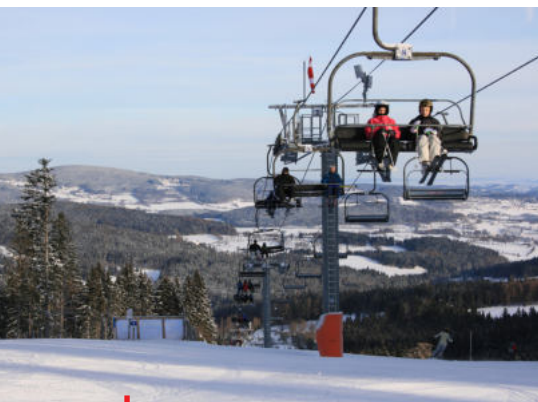
Lyžařský areál Zadov

Bylo to divadlo, bojkot není přece tím hlavním tématem. Proč pan Kejval nesvolal olympijské svazy a neprobral to s nimi? Proč neinformoval svazy, o co se hraje, a proč jim neporadil, jak mají postupovat? Právě jednotlivé národní svazy mohou napsat svým mezinárodním federacím, že Česko je proti návratu Rusů v jakékoliv podobě, kterou do té doby navrhoval MOV.