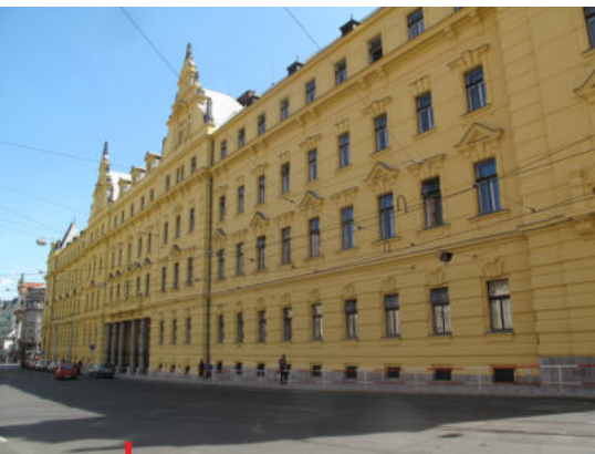
Budova Městského soudu v Praze

Během týdne v rámci doplňujících výpovědí došlo v soudní síni na všechny obviněné a na několik svědků.