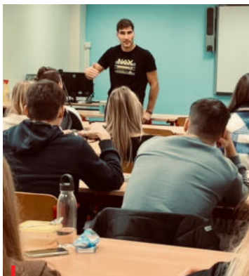
Beseda s olympijským vítězem Davidem Svobodou

Profil absolventa a uplatnění absolventa Management sportu ZDE a Wellness specialista ZDE .