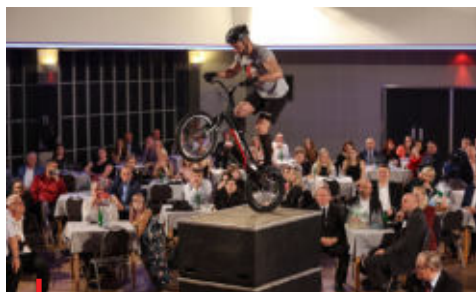
Součástí slavnostního galavečera bývají i zajímavá vystoupení místních sportovců

Česká unie sportu anketu Nejúspěšnější sportovec regionu podporuje a velice oceňuje její význam, protože plní důležité poslání. Jejím prostřednictvím může také účinně propagovat svou činnost a cíle, pozici ve sportovním prostředí jako největší sportovní organizace v České republice i význam územních pracovišť ČUS. Tím, že anketa vyzdvihává regionální sportovní hrdiny a osobnosti, se podílí nejen na propagaci lokálního sportu či jeho tváři v obcích, městech a krajích, ale také přibližuje mládeži místní vzory a motivuje je tak k jejich napodobení a pravidelné sportovní činnosti.