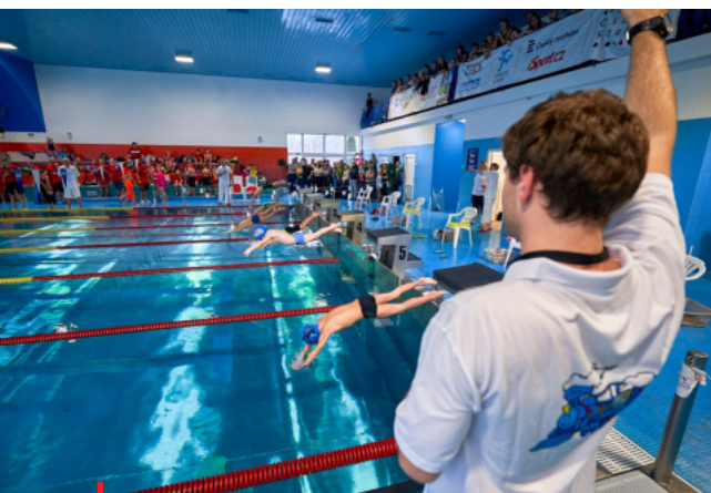
Bez pomoci vlády nebo Ministerstva průmyslu a dopravy ČR čeká provozovatele bazénů přetěžká sezona

Předseda ČUS také informoval členy výkonného výboru o přípravě státního rozpočtu na rok 2023, v němž vláda navrhla pro sportovní prostředí pouze 6,75 miliardy korun, což je celkově o více než jednu miliardu méně než v roce 2021. V praxi to znamená, že na neinvestiční výdaje sportu, tedy na trenéry, činnost klubů, svazů či provoz sportovišť, vláda na rok 2023 vyčlenila pouze 4,9 miliardy Kč, o 0,7 miliardy méně než v letošním roce - to vše při násobných cenách energií. Tato částka je jedna z nejnižších, které směřovaly do sportu od roku 1989. Nejen že naprosto neodpovídá dlouhodobým potřebám českého sportu, ale neumožní mnoha klubům, zejména vlastníkům sportovišť přežít.