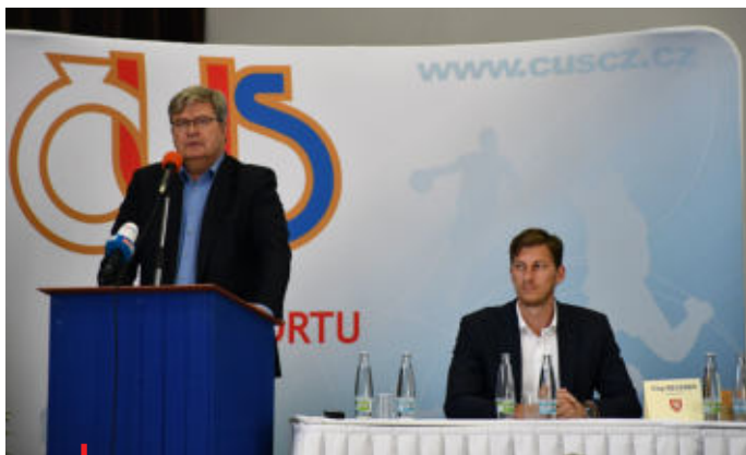
Předseda ČUS Miroslav Jansta kriticky hodnotil aktuální situaci českého sportu

Finanční podpora státu se snižuje, meziroční pokles skutečné státní podpory sportu činí 25 procent. Takový propad nezaznamenal žádný jiný rezort. Na letošní rok je pro sport rozpočtováno 4,6 miliardy korun. Jen pro předstihu - jde o polovinu menší objem oproti financování sportu z počátku 90. let. A o třetinu nižší podporu než v roce 2007. „Podpora sportu klesá i bez inflace a narůstajících cen za energie. Od nové vlády jsme očekáváme změnu, racionalitu a pochopení významu sportu pro stát, to ale zatím nepřichází. Přitom podle vládov schválené koncepce Sport 2025 mělo být všechno jinak a na sport by mělo jít v roce 2025 minimálně 19 miliard korun. Jsme někde na jedné čtvrtině,“ vyčíslil Miroslav Jansta.