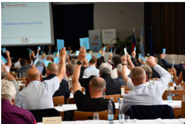
Delegáti 40. valné hromady při hlasování

Česká unie sportu zpracovala také analýzu dosavadního plnění koncepce Sport 2025. Tento materiál byl schválený usnesením vlády před šesti lety a výtýčil směry a cíle rozvoje a podpory českého sportu. Jedou z priorit bylo zastavit pokles tělesné zdatnosti dětí a mládeže, zastavit růst nadváhy a obezity, snižovat ekonomickou spoluúčasť rodin ve sportu, zvyšovat pohybovou gramotnost. Koncepce rovněž ukládá cílově navýšovat objem prostředků na sport ze stávajících 0,3 % na 1 % celkových výdajů státního rozpočtu. Nikdo však koncepci neplnil a žádný člen vlády plnění nekontroloval ani nepožadoval.