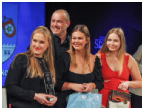
Nejlépeším kolektivem Strakonicka se staly vodní pólistky TJ Fezko Strakonice