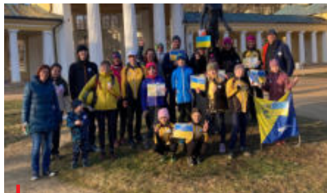
Mariánskolázeňský Orientační klub uspořádal Mločí orientáku pro Ukrajinu

Výše nasbíraných příspěvků od účastníků v průběhu těchto aktivit předčila očekávání - k 9. březnu bylo na účtu přes 420 tisíc Kč. Výkonný výbor