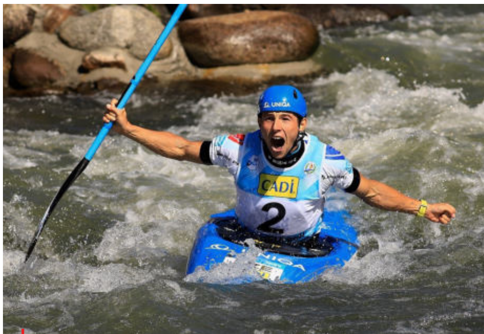
Mezinárodní úspěchy v českém sportu sbírají především zástupci individuálních disciplín.

no a schváleno státem. Stát se k tomu zavázal a neplní to! A k tomu, aby to plnit začal, potřebujeme mít jasnou hlavu, co to řídí. A MŠMT to rozhodně není. Stačí se podívat na brutální amatérismus v jejich konání v minulých letech. Vyšel na povrch i díky soudu, který mě nedávno zprostil všech nesmyslných obvinění v takzvané dotační kauze. Mimochodem tohle je obrovská ostuda českého státu, který i tímto sportem jednoznačně poškodil.“